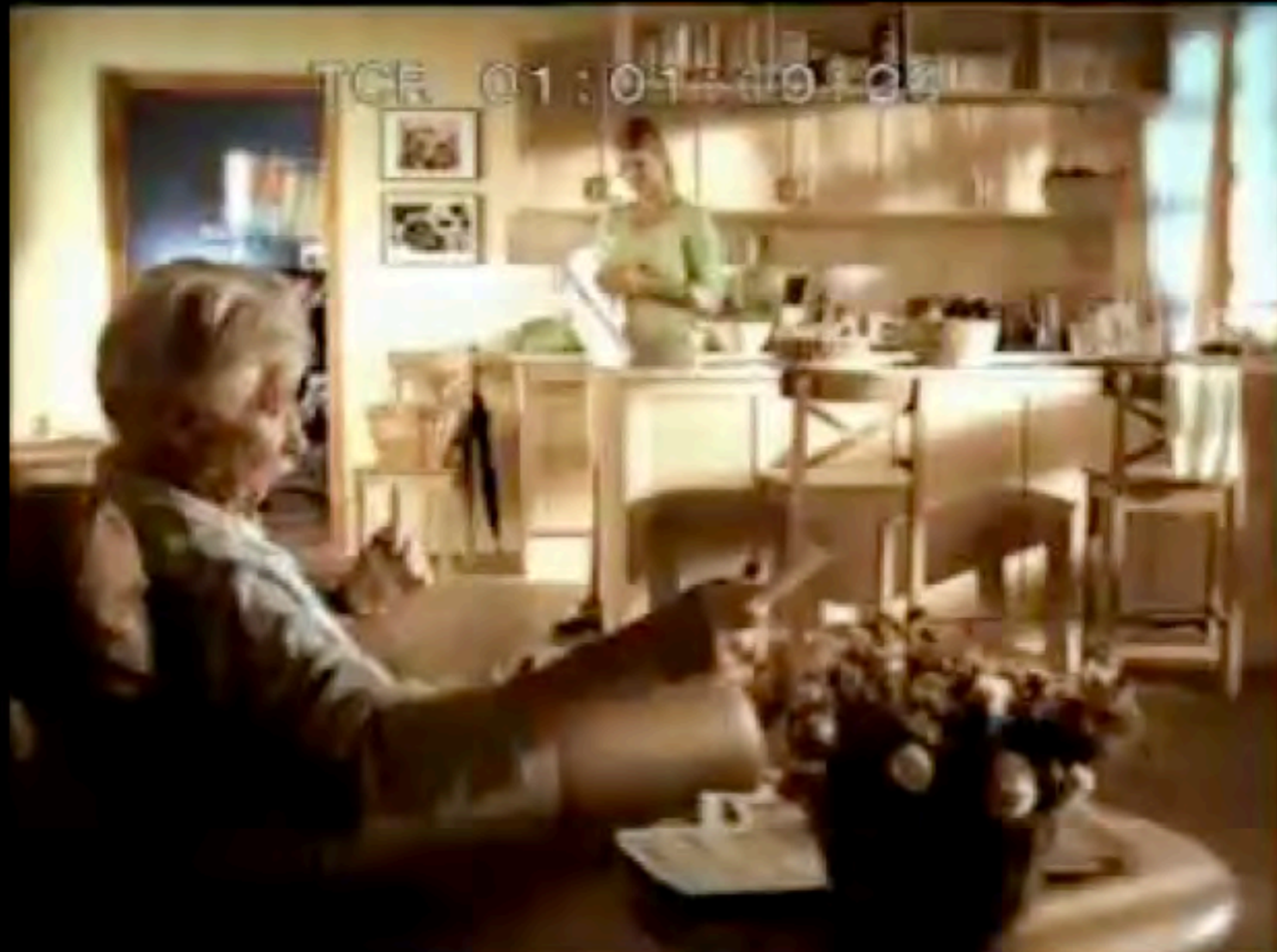
Chio hagyományos 0:29