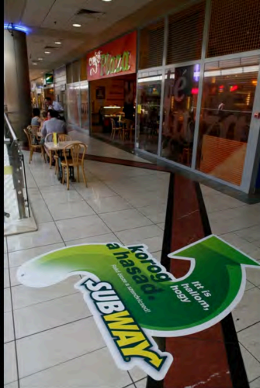
Subway – ilyen lett