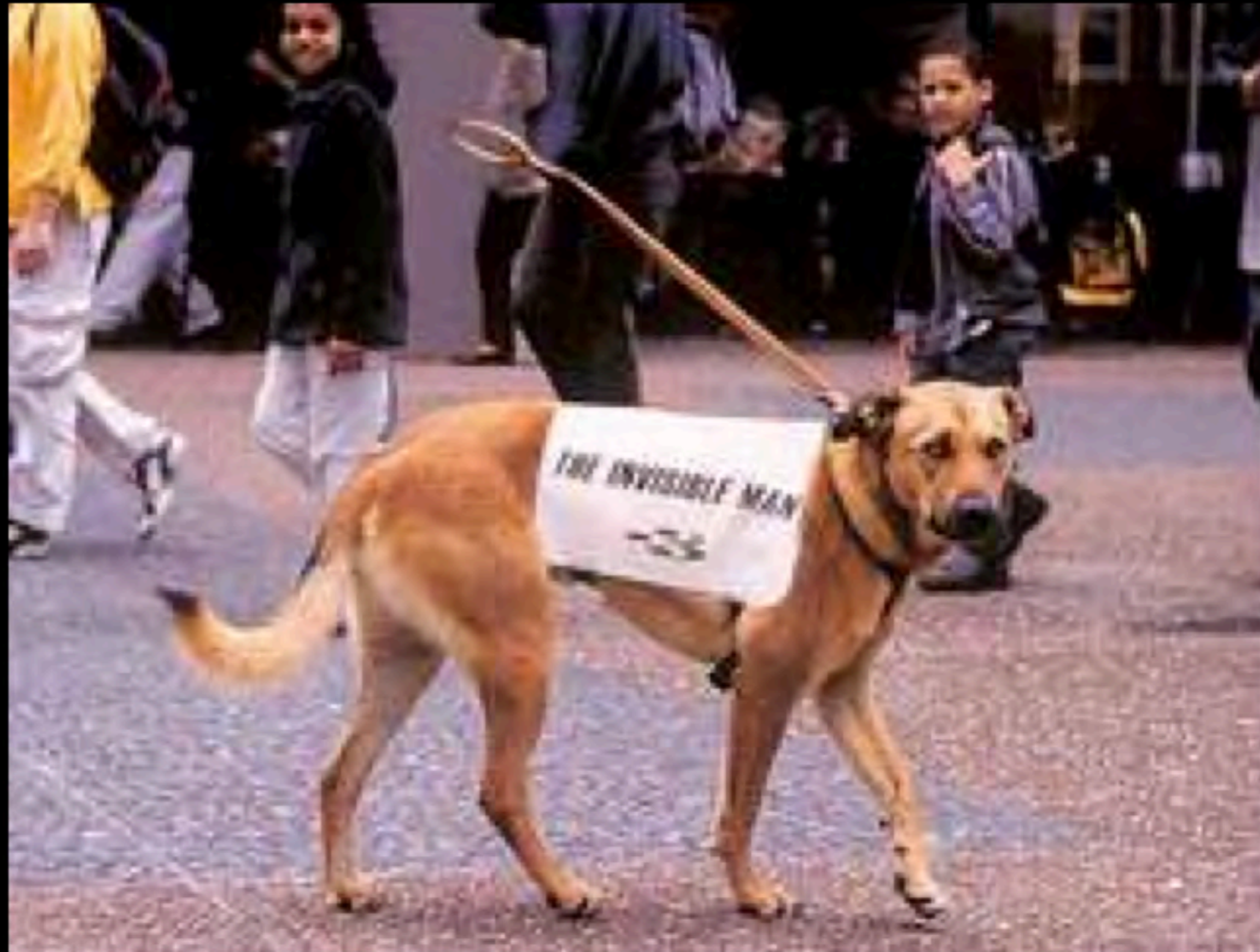
The invisible man