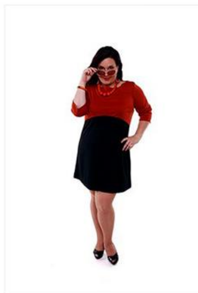
"Colour blocking" ruha / karamell-fekete